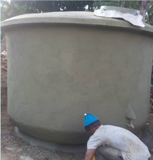
Technici experimenteren met grotere tanks van 10.000 liter