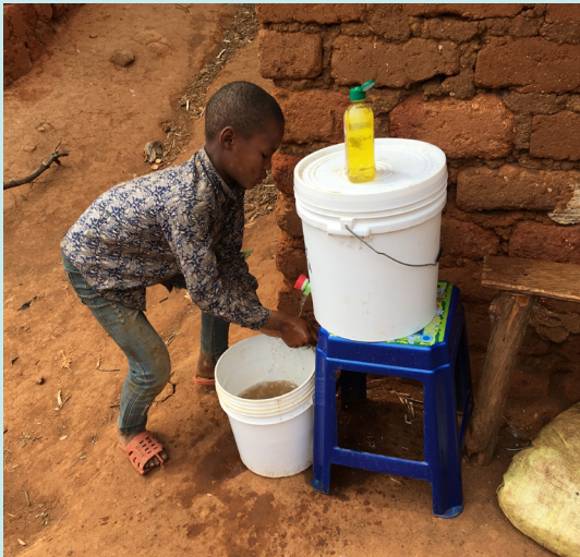
Handwasfaciliteiten en zeep werd gedistribueerd en geplaatst nabij de woningen.