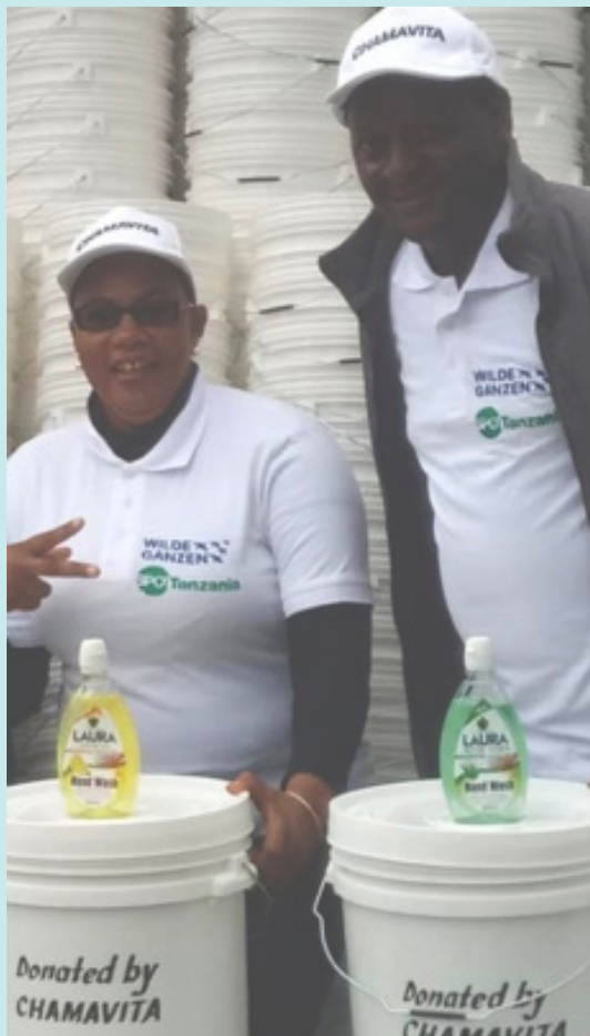
Distributie van handwasfaciliteiten, zeep en informatiemateriaal door vrijwilligers in samenwerking met lokale (gezondheids) autoriteiten.