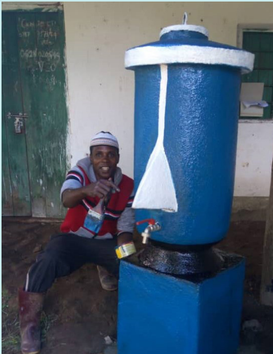
Baby-calabash van 20 liter