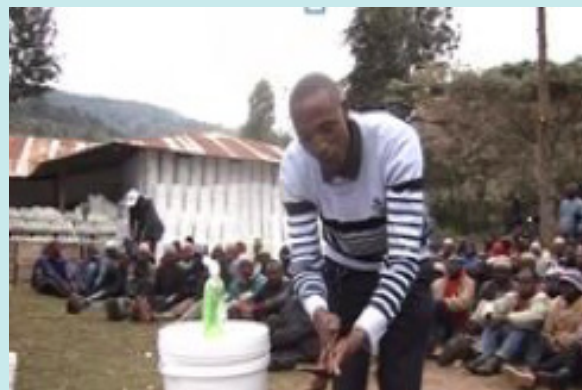
Informatievoorziening en instructie aan dorpingen in de verschillende gebieden.

Dank aan Wilde Ganzen en aan alle goede gevers die dit onvoorziene noodproject hebben mogelijk gemaakt. En dank aan alle medewerkers en vrijwilligers die Chamavita gemobiliseerd heeft om deze logistieke krachttoer te realiseren!