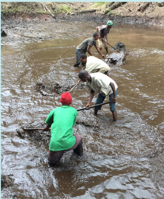
Waterbekken van Lukozi Water Supply Project wordt uitgebaggerd om de opvangcapaciteit te vergroten.